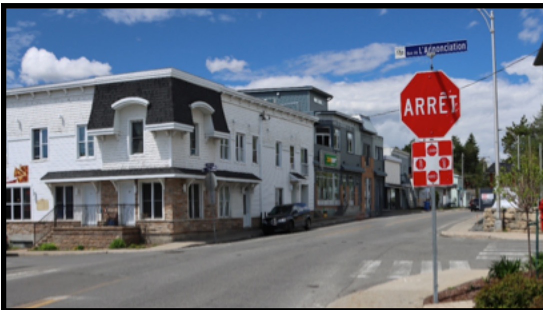
11