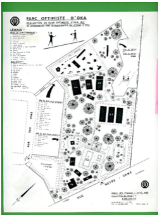
Figure 4 | Plan d'aménagement du Parc Optimiste