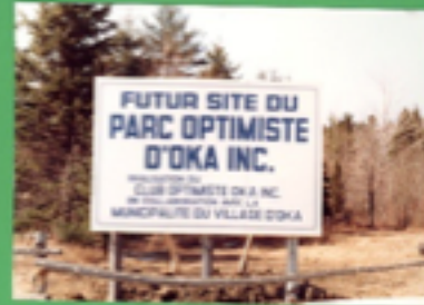
Figure 5 | Futur site et début de la construction du Parc Optimiste