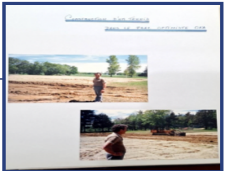
Figure 9 | Construction du terrain de tennis du Parc Optimiste en 1987