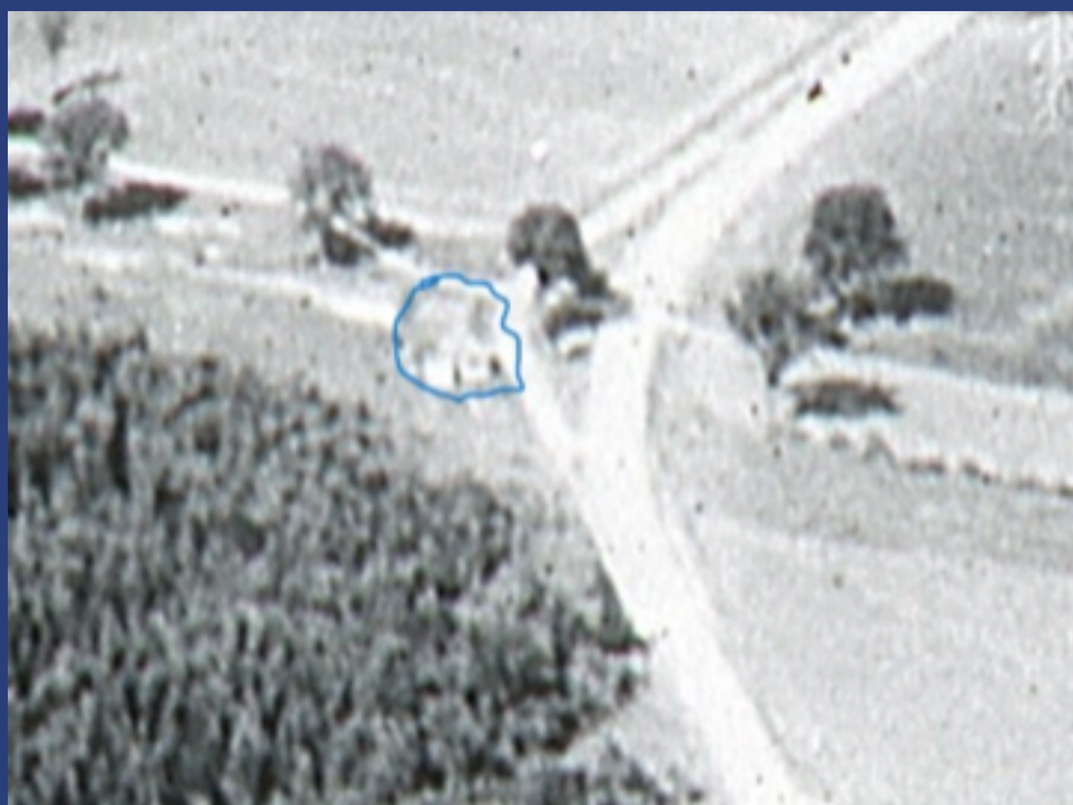
Figure 3 | Photo aérienne de la maison Renaud, abandonnée et incendiée par les pompiers pour un exercice de feu vers 1980.