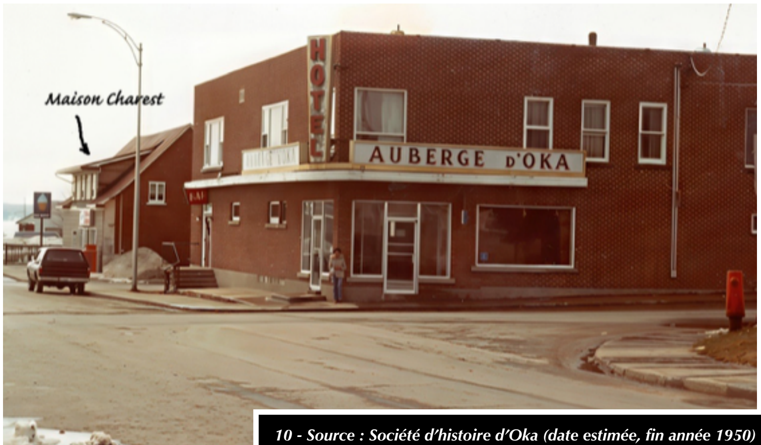
10 - (date estimée, fin année 1950)