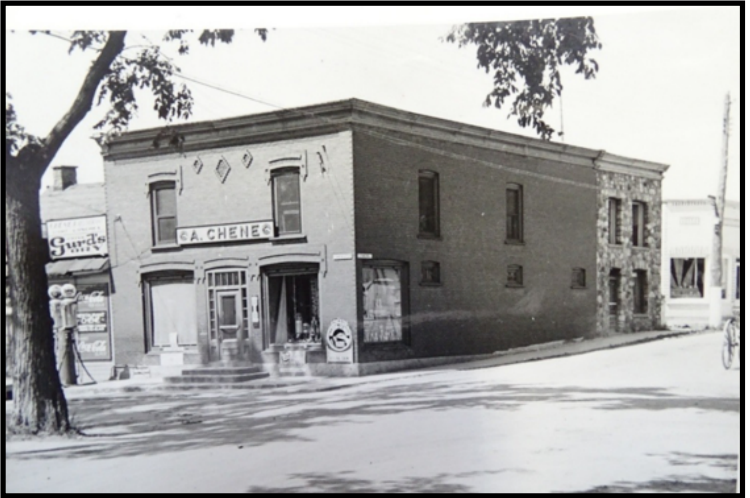
Photo réalisée à peu près à la même époque que la précédente du magasin général Chéné avec son entrepôt en pierre entre son magasin et le magasin Cadieux. On note, sur la gauche, la pompe à essence, en partie cachée par l'arbre, qui semble avoir été déplacée du coin de rue.

« Le magasin général, pilier des communautés rurales aux XIXe et XXe siècles, était un commerce tout-en-un proposant épicerie, quincaillerie, vêtements et outils. Véritable centre social, il servait de point de rencontre, de bureau de poste et de relais pour les voyageurs. Il a décliné avec l'arrivée des supermarchés et de l'automobile. »