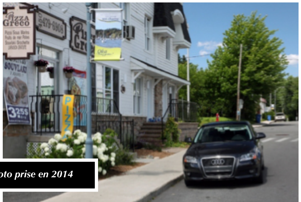
5 - Source photo : Réal Raymond, photo prise en 2014

Près de 75 ans plus tard, en 2014, on constate que la salle de billard a été démolie ( date? ) et a fait place à un petit stationnement, sur le coin St-Martin et de l'Annonciation (au bas coin gauche). Le restaurant Chéné est devenu Pizza Greco. Le magasin général Chéné devient l'Auberge Oka qui elle-même sera réaménagée en appartements locatifs. Sur le coin opposé, l'Hôtel Longtin fut détruit par un incendie le 27 décembre 1964 et n'a pas été reconstruit. Le terrain est resté vacant plusieurs années. Derrière la rangée d'arbres sur le terrain vacant, non visible, on trouve la maison ayant tenue le bureau de poste d'Oka durant les années 1950. L'auto sur la photo est une Audi mais désolé, on ne sert plus d'essence!